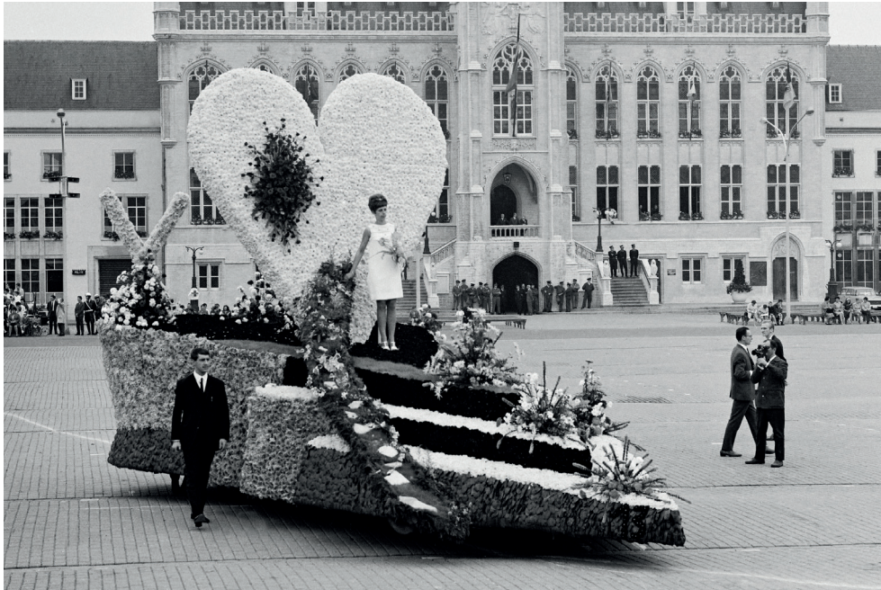
Grote Markt Sint-Niklaas, bloemenstoet 1968, praalwagen aangeboden door de jeugdclub 'Oase', Kriko, met als thema 'Weg naar de vrede' (ontwerp: Robert Polfliet).

Er werd geduwd en gestampt om luciferdoosjes, potloden of snoepjes te veroveren.