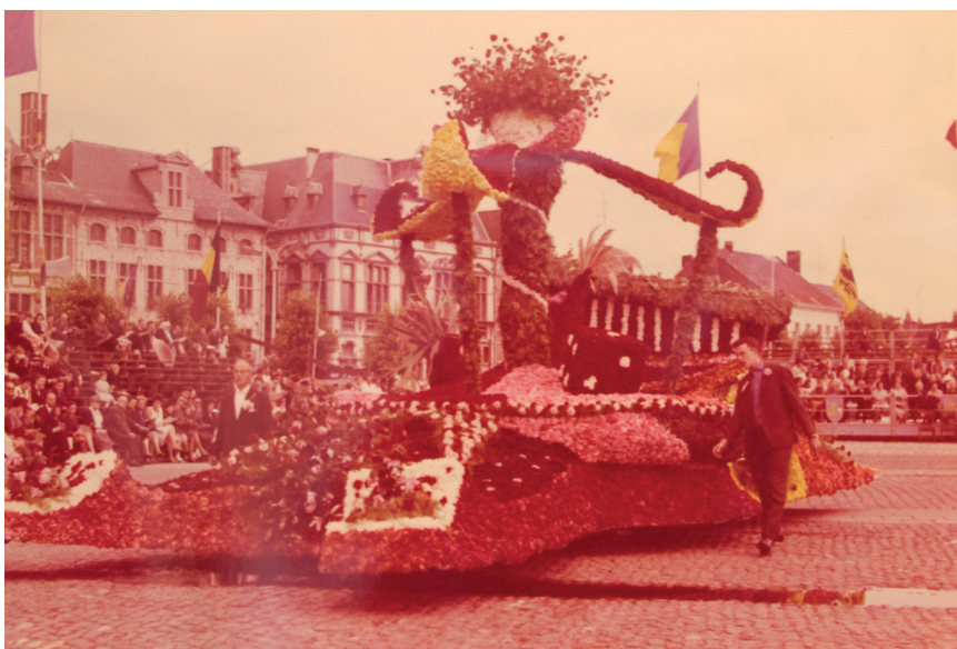
Grote Markt Sint-Niklaas, bloemenstoet 1963, praalwagen aangeboden door de K.A.J. en de K.W.B. Sint-Jozefparochie Sint-Niklaas met als thema 'Fantasiemolen' (ontwerp: Roger De Smet; realisatie: Vereniging der Fleuristen.

volksdansen in het stadspark. Het vereenvoudigde parcours en de vlot bollende wagens zorgen voor een rustig tempo. Alle wagens worden geduwd zodat er geen hinder meer is van sputterende motors. De kwaliteit van de groepen en de praalwagens is vergelijkbaar met de voorbije jaren. Maar 'iets nieuws' staat niet op het programma en het aantal toeschouwers volgt de dalende lijn die de voorbije jaren is ingezet. Als tussenstuk brengen de Trommelaeren van Roosendaele een taptoe. De stoet telt 33 items waarvan 14 bloemenwagens. Algemene bewondering oogst de praalwagen Fantasiemolen , aangeboden door de K.A.J. en de K.W.B. Sint-Jozef, naar een ontwerp van Roger De Smet. De wagen, die een molen draagt met draaiende wieken, krijgt de Prijs van de Stad Antwerpen voor de beste constructie. Het valt op dat een zekere modernisering in het ontwerp van de wagens zich doorzet: de lijnen zijn strakker, de thema's minder idyllisch en de ontwerpen non-figuratief. Voor 85% van de wagens worden de bloemstukken gemaakt door de Unie der Fleuristen; de plaatselijke bloembinders staken hun medewerking, met uitzondering van de firma Neyts-Geldolf uit Zaffelare en de Gebroeders De Smedt uit Sint-Niklaas. Sinds 1957 haken meer en meer Sint-Niklase bloemenverkopers af. 23