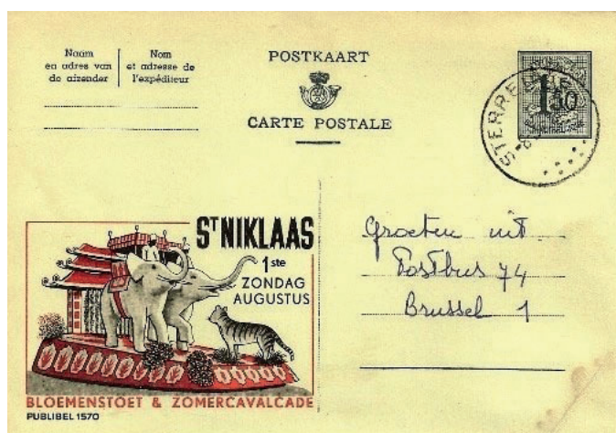
Gele briefkaart met reclame voor bloemenstoet

toeschouwers die ieder jaar terug komen en in groter aantal. Het inrichtend Comité heeft de gewaardeerde medewerking bekomen van de Rijkswacht van het district en aanpalend district, van de plaatselijke Politie- en Pompierskorpsen, van de Belgische Buurtspoorwegen, alsmede de ploeg van Touring Wegenhulp en van de groepering der Autocaristen. Hier geen inkomgeld in de stad, slechts een gering parkingsrecht in de bewaakte parkeerplaatsen. Op de spoorwegen genieten de reizigers, zelfs afzonderlijk, van verminderingen gaande van 35 tot 50 % op de reisbiljetten, op voorwaarde dat ze op 4 augustus "een reisbiljet heen en weer Sint-Niklaas, Bloemenstoet" aanvragen. 17