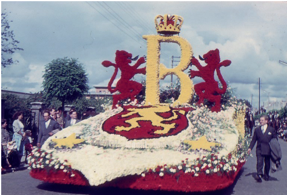
Bloemenstoet 1955 's Koningswagen', aangeboden door de Firma drukkerij Jos D'Hondt, eigen ontwerp en uitvoering

Kerchove en voeren kleine herstellingen uit aan bloemenwagens in de straten. Een motor van de begeleidende politie dient hersteld te worden; er zijn depannages bij de reclamewagens en een van de bloemenwagens bereikt op sleeptouw genomen door een camionette, de Grote Markt. 15