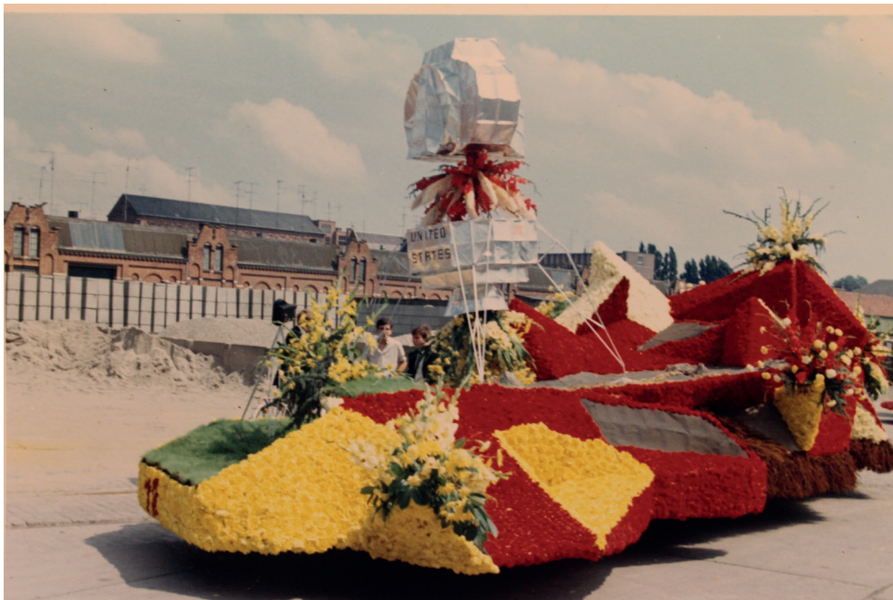
Grote Markt Sint-Niklaas, bloemenstoet 1969, praalwagen aangeboden door de K.A.J. van de O.-L.-Vrouwparochie met als thema 'Apollo 11' (Foto: Erfgoedcel Waasland, particuliere collectie Willy Van Brande).

Ondanks het schitterende weer zijn er bij de aanvang van het feestgebeuren weinig belangstellenden op de tribunes. In de loop van de middag komen enkele duizenden kijklustigen postvatten maar het is voor iedereen duidelijk dat hun aantal is verminderd. De wagens zijn nochtans prachtig en de onderwerpen actueel. Het middenspel wordt opnieuw verzorgd door de Trommelaeren van Roesendaele. Net als de voorbije jaren wordt er een autotentoonstelling opgesteld. De organisatoren, zich bewust van het verminderde succes, beseffen dat ze volgend jaar voor vernieuwing moeten zorgen. 30