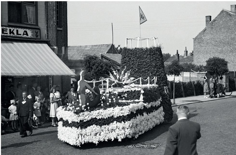
Bloemenstoet 1950, 'Nymphaea', aangeboden door de firma Jolicor (corsettenfabriek)

schoonste en het rijkste bloemenfeest van België. In een Nederlandse krant staat te lezen: Een feest in Vlaanderen is geheel iets anders dan een feest bij ons. Des middags bleken alle 46.000 bewoners op de been en daarbij nog ettelijke duizenden uit de omgeving. Het was een onbeschrijflijke stoet. Over de organisatie niets dan lof: 47 "nummers" trokken voorbij in de beste regelmaat en keurig op tijd. Het was een prachtig staaltje van Vlaamse humor en leutigheid. Wat denkt u van een parodie op "Le Tour de France Sarthois". De oude gloriën en de markantste renners zoals Selleir, Motial, Faber, Garrigou, Bottechia ... putten zich uit in een ononderbroken reeks van sprinten en ont-snappingen op de zotste rijwielen: rijwielen met niet-ronde wielen, autopeds op twee wielen tot fiets geconstrueerd... En dit alles met een ernst ten uitvoer gebracht alsof de zotheid tot hoge wijsheid geworden was. Veel zou er nog te zeggen zijn van deze kleurige cavalcade: er was een ezelwagentje, waarvoor een langoor, die op het juiste moment voor de eretribune balkte. Het wil ons voorkomen dat zulks alleen maar aan een Vlaamse ezel kan worden bijgebracht. 12