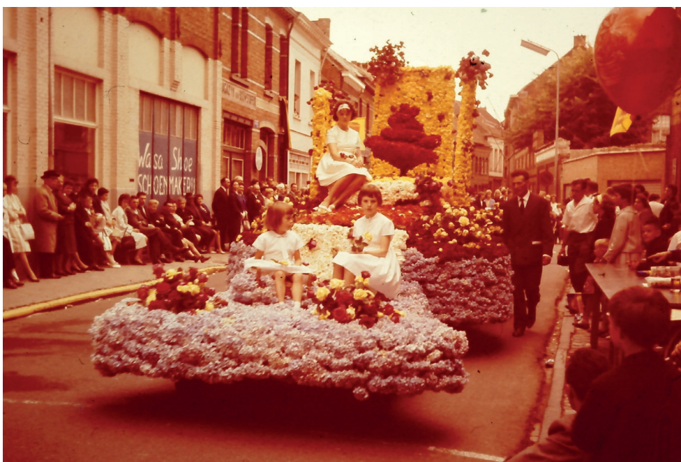
Kalkstraat Sint-Niklaas, bloemenstoet 1962, praalwagen aangeboden en gerealiseerd door de firma L. Neyt – Geldolf (bloemist in Zaffelare) met als thema 'Rozen-Symphonie' (ontwerp: architect Van Mossevelde.

het kopen van een steunkaart? Vele straten werden niet eens door de afgevaardigden bezocht. Sint-Niklaas heeft een traditie hoog te houden. Maar het is een eerste vereiste allen solidair te zijn. Onze bloemencorso, die West-Europese vermaardheid heeft gekregen, mag geen gevaar lopen te verdwijnen door onenigheid. Er zijn jaren geweest dat verschillende wijken van de stad zich inspanden om een bloemenwagen te laten meerijden. Jammer genoeg zijn deze allemaal van het programmaboekje verdwenen. Wij kunnen begrijpen dat sommige initiatiefnemers het na enkele jaren opgeven, omdat de medewerking op de duur te wensen overlaat. Volgend jaar moeten wij beslist de buurtschappen in onze stoet zien verschijnen. 22