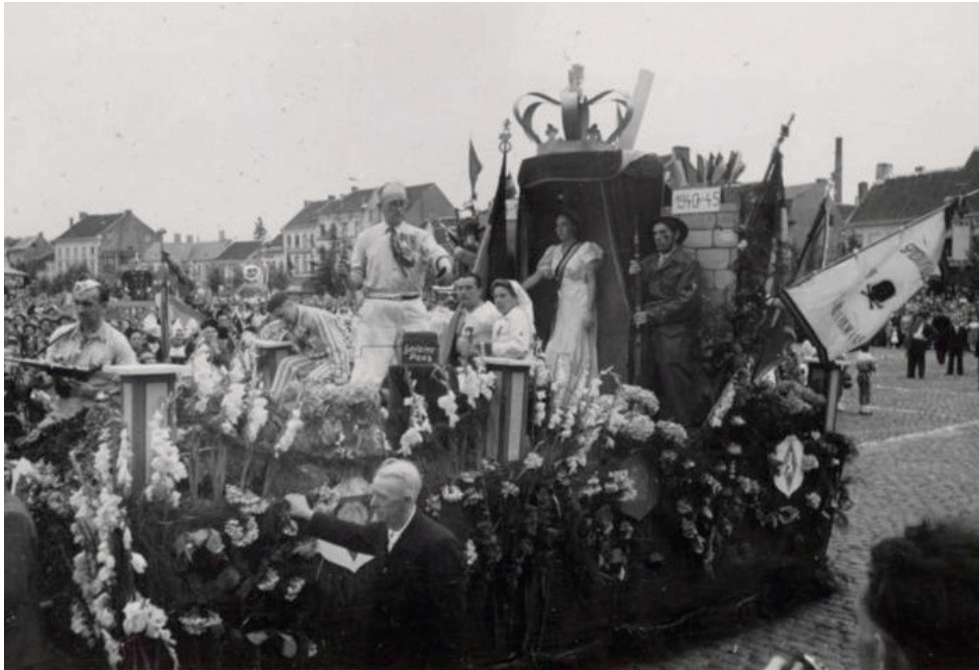
Grote Markt Sint-Niklaas, bloemenstoet 1 augustus 1948; praalwagen van het patriottisch comité van Sint-Niklaas rond het thema 'Verheerlijking van België'

ringen laten zich bewonderen: Steltlopers uit Merchtem, Volendammers uit Gent, De Verenigde Gusten uit Ledeberg, Dansende Signors en Signoritas uit Brugge, Schaatsenrijders uit Dendermonde, Moderse Harlekijnen uit Kortrijk, De Ware Gilles uit Aalst, ruiters met vaandels, Koninklijke Harmonie De Kunstvrienden, De Lustige Reizigers, De Christoffelvrienden, De Kleibeek's Vrienden, Kracht en Geduld... Nieuwe wagenbouwers, waaronder een aantal plaatselijke bloemisten, bouwen samen veertien praalwagens. Twaalf dansgroepen zetten hun beste beentjes voor tijdens de apotheose. 11