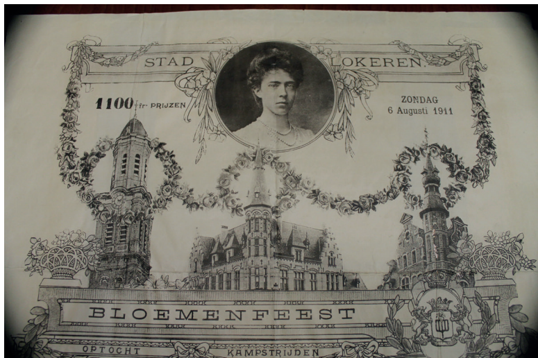
Deze affiche kondigt de bloemenstoet aan van 6 augustus 1911 te Lokeren (Stadsarchief Lokeren)

In 1930 viert België haar honderdjarig bestaan. Op maandag 21 juli wordt een Groote bloemen- en Historische stoet gevormd met 5000 deelnemers en 30 praalwagens. Groepen en praalwagens beelden de nationale nijverheden uit: metaalnijverheid, landbouw, visvangst, scheepvaart... Men brengt hulde aan het vorstenhuis, Guido Gezelle, Hendrik Conscience... Een militair concert, vuurwerk en een volksbal vervolledigen het spektakel. 6