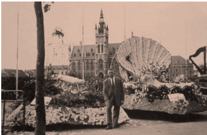
Grote Markt Sint-Niklaas, bloemenstoet 1961, praalwagen aangeboden door de Sint-Niklaase Basketball-Club met als thema 'Vogeltje gij zijt gevangen' (ontwerp: Maurice Fels, realisatie: Unie der Fleuristen van België, afd. beide Vlaanderen.

In tegenstelling tot het voorbije jaar verloopt alles op wieltjes en de kritieken zijn zeer lovend. De reactie van twee Keulenaars: Wij waren sceptisch naar Sint-Niklaas gekomen. Wat zou een industriële stad, die geen bloemenstad is, op gebied van bloemencorso kunnen verrichten? Hetgeen wij hier gezien hebben grenst aan het ongelooflijke. De woordvoerder van een groep uit Brugge: Wij Bruggelingen kunnen spreken van grote stoeten. Hetgeen wij gisteren in Sint-Niklaas zagen, overtrof onze verwachtingen. Wij komen zeker terug in 1962. En twee Brusselaars getuigen: Wij zagen stoeten in Nederland en in Zwitserland. Nergens kon een corso ons zo bekoren als in Sint-Niklaas. 21