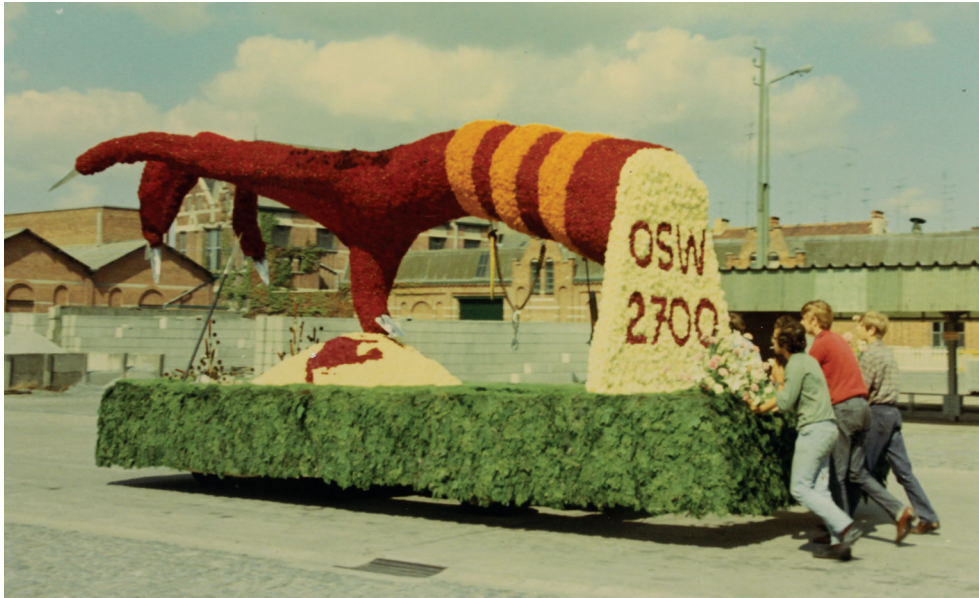
Bloemenstoet 1970, pralwagen aangeboden door de vereniging Ontwikkelingssamenwerking 2700 met als thema 'Bevrijding' (ontwerp: Jan Buytaert).

kadert in de evenementen rond de Bevrijdingsfeesten. Burgemeester Frans Van Dorpe stelt: In september is er meer volk en er zijn meer bloemen beschikbaar tegen voordeliger prijzen. De bloemenstoet brengt een bijkomende weelderige tint aan onze Bevrijdingsfeesten. Aan de bloemenstoet wordt een filmwedstrijd verbonden. Een jury beoordeelt de films en reikt de prijzen uit (eerste prijs: 5.000 Bfr.).