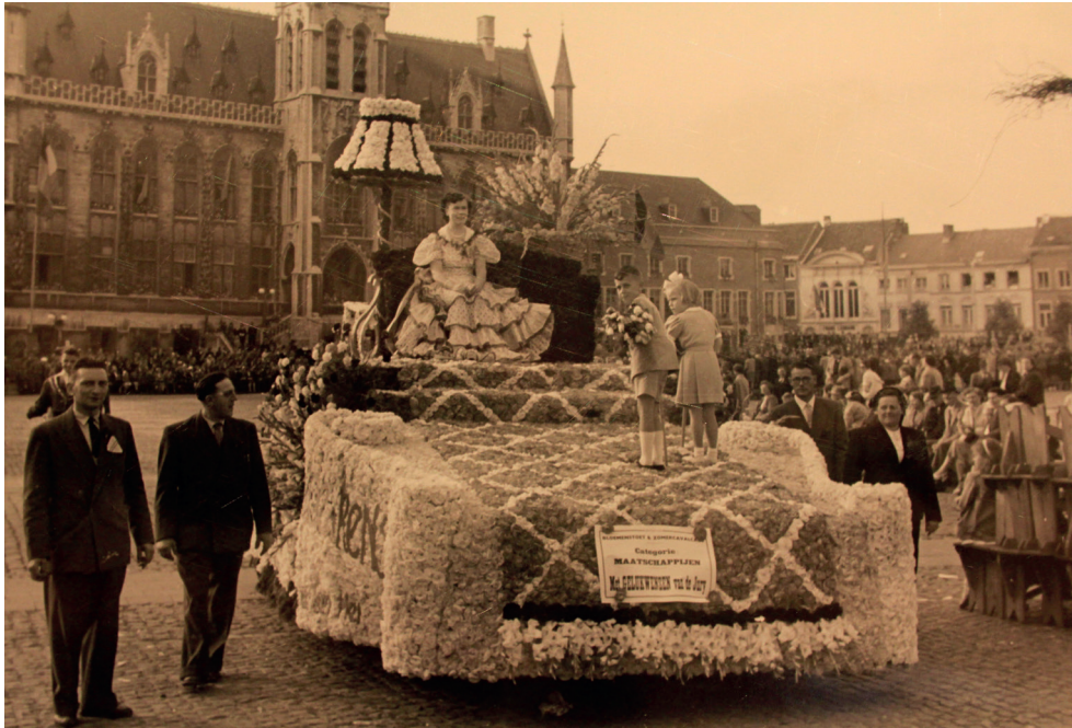
Grote Markt Sint-Niklaas, bloemenstoet 1954, praalwagen van Stedelijke Dienst van Openbare Werken, eigen ontwerp: "Moederkensdag"