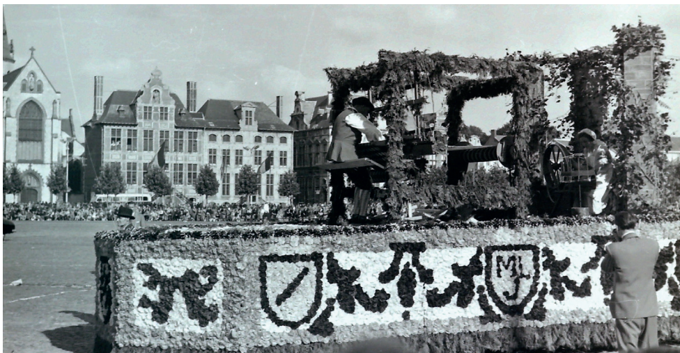
Grote Markt Sint-Niklaas, Bloemenstoet 1952, 'Jan Wever'. Deze wagen heeft als thema de weefnijverheid in de 18 de eeuw. De wagen werd aangeboden door de Firma N.V. Janssens, Meubelstof- en Lakenweverijen.

Opmerkelijk is de brief die het stadsbestuur richt aan de bewoners: In het kader van de 7de Bloemenstoet en Zomercavalcade heeft het comité verschillende vormen van reclame voorzien: dagbladartikelen, radiotoespraken, affiches, reclameborden, decalcomanies (afplakkers). Al de automobilisten van onze stad en omliggende zullen voorzeker graag aan de propaganda meehelpen. Degenen welke onze actie willen steunen kunnen op onze p.c.r. Nr. 46.56.17 een overschrijving doen van à ratio 5 fr. per decalcomanie, zijnde dekking onzer onkosten. Overtuigd van Uw geestdriftige medewerking, bieden wij U, Mijne Heren, de verzekering onzer oprechte hoogachting. Wijze van gebruik : Bevochtig de voorruit van het rijtuig langs de binnenzijde, breng het decalcomanie met de kleurzijde tegen het glas en bevochtig goed de achterzijde. Na enkele minuten het witte papier voorzichtig verwijderen. 13