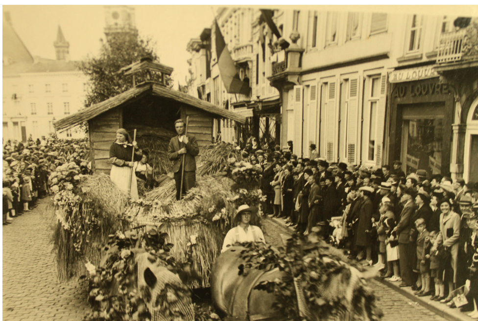
Grote Markt Sint-Niklaas, bloemenstoet 1939, wagen nr. 7, aangeboden door de Koninklijke Tuinbouwmaatschappij van Sint-Niklaas, met als thema 'Hulde aan den tuinbouw'

clamestoet en de bloemenstoet. De wagens dragen namen als: Hulde aan de tuinbouw , Moeders naamfeest in de Volkstuin , Sneeuwitje ontwaakt uit haar eeuwige slaap en Wat mij lief is . Na de uitspraak van de jury worden de prijzen en premies uitgereikt in het stadhuis, gevolgd door een danswedstrijd op het marktplein. De reactie van het stadsbestuur na afloop van de festiviteiten wekt verbazing: de verantwoordelijken tonen zich ontevreden over de medewerking van de bewoners van de Wase hoofdstad. 9