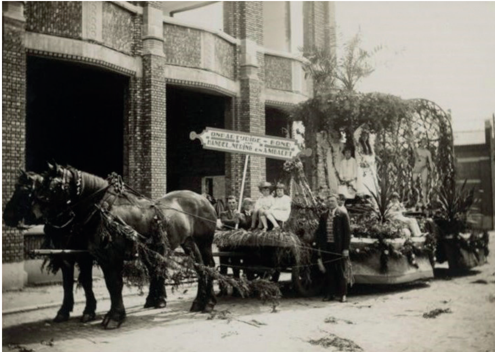
Bloemenstoet 1930, wagen aangeboden door de Bond voor Handel en Neringdoeners