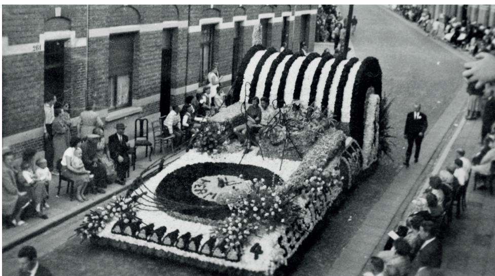
Schoolstraat Sint-Niklaas, bloemenstoet 1958, pralwagen 'Calypso Disco-bar' met geluidsversterking van de "radiodistributie", aangeboden door de Sint-Niklase Basketball-Club (ontwerp: Marcel Noens, realisatie: gebroeders De Smedt)

In het raam van de feestelijkheden rond de Wereldtentoonstelling te Brussel wordt gestreefd naar een sublieme uitvoering van de bloemenstoet te Sint-Niklaas. Tijdens dit 'expojaar' worden maatregelen genomen om ook los van de Wereldtentoonstelling te Brussel manifestaties in de provincies te laten plaats vinden. Dit project draagt de naam 'Expo extra muros'. Op provinciaal vlak worden speciale comités opgericht. Sint-Niklaas kan hierdoor rekenen op een extra toelage van 400.000 frank voor het organiseren van de bloemenstoet. De opkomst is ongekend; er zijn 20.000 kijklustigen meer dan in 1957. Op het marktplein wordt een ruitertornooi georganiseerd. Vrachtwagens voeren honderden tonnen Scheldezand naar de Grote Markt, werklieden leggen een piste van 80 op 60 m aan voor een ruiterspel. Honderdvijftig van de beste ruiters van de Landelijke Vereniging van de Boerenjeugdbond (BJB) brengen een ongezien spektakel: Zij voeren angstwekkende evenwichtsoefeningen uit die niet moeten onderdoen voor de ruitersfeesten van de Kozakken na de Eerste Wereldoorlog of voor de Marokkaanse Spahia. 18