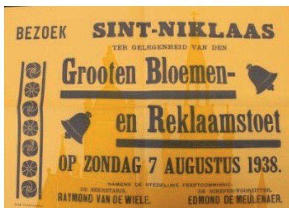
De Stedelijke Feestcommissie liet deze affiche verspreiden ter gelegenheid van de stoet in 1938