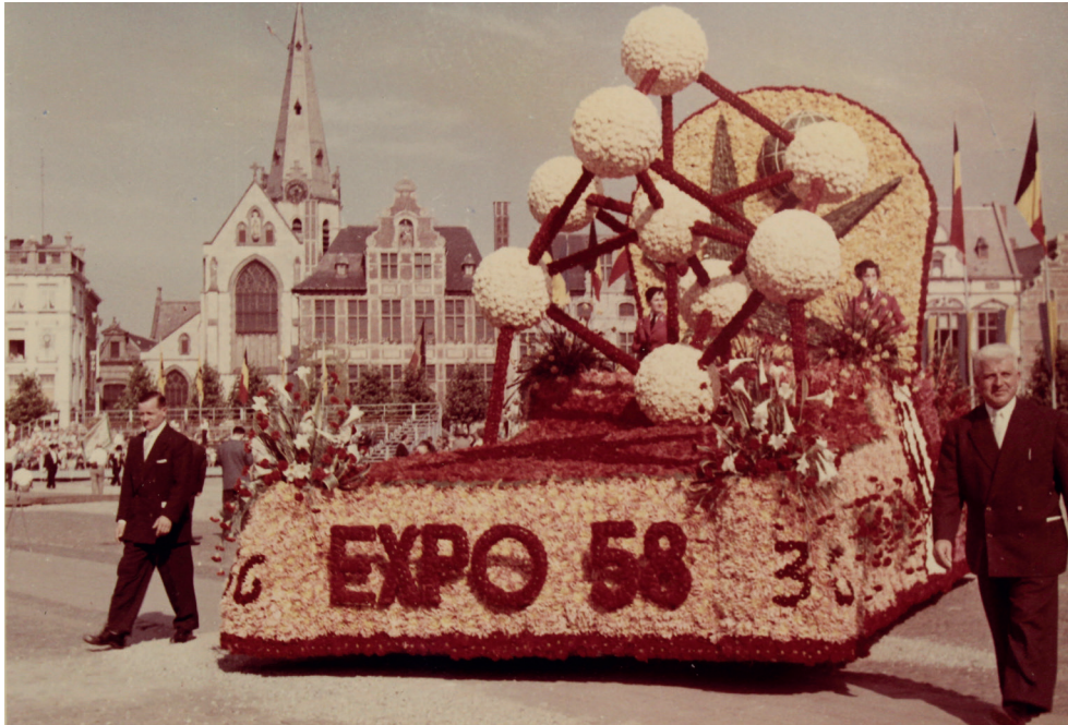
Grote Markt Sint-Niklaas, bloemenstoet 1957, praalwagen aangeboden door het buurtschap Watermolendreef met als thema 'Expo '58'

huis, bij de Touring Club van België, bij de Vlaamse Toeristenbond en bij een aantal reisagentschappen. Nieuw op 4 augustus 1957 is de autoshow op de Grote Markt.