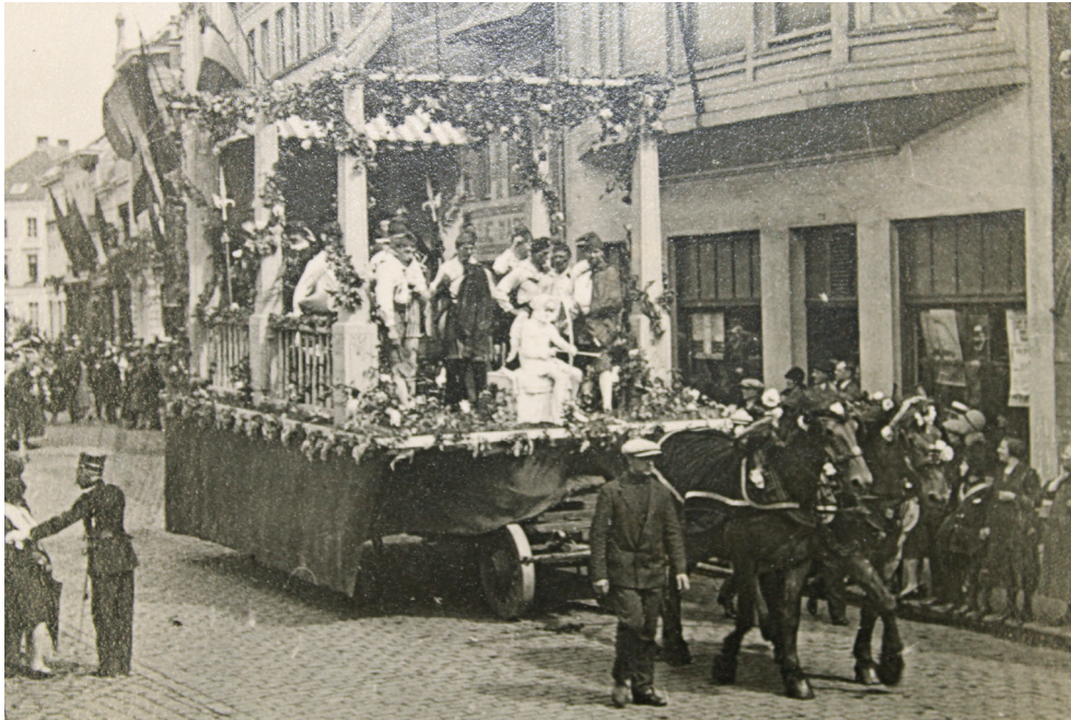
Wagen met als thema 'De Stomme van Portici', aangeboden door de 'Koninklijke Retorica-maatschappij 'Vreugd in deugd', Markt Lokeren 21 juli 1930