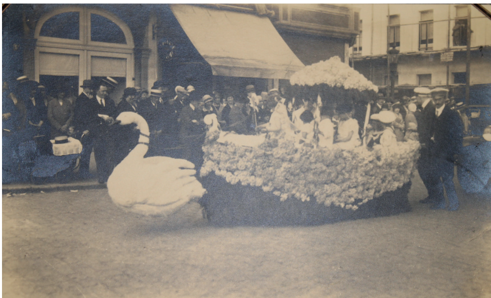
Bloemenstoet 1930, wagen aangeboden door het 'Werk der gezonde melk'